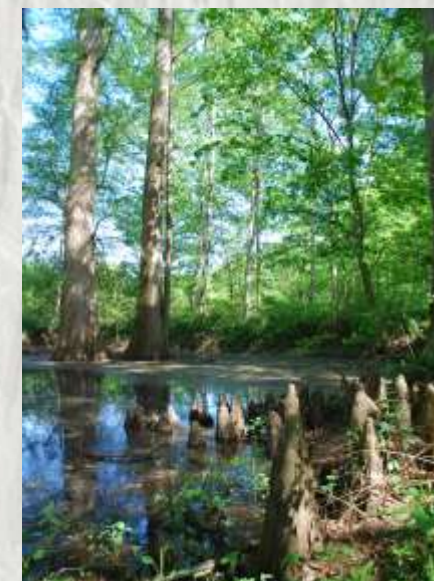
Forêt de Barbeau : Mare avec cyprès chauve

Le parcours en forêt domaniale de Barbeau s'effectue entre des vallons et un balcon sur la Seine, pour observer la flore des sous-bois et des champs.