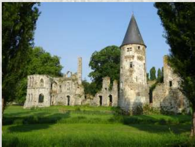
Le Château du Vivier – Photo CD ©