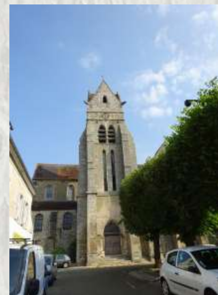
L'Église de Chaumes-en-Brie

Le Vivier, avec ses étangs et les ruines de son château, la vallée de l'Yerres dominée par le viaduc de l'ancienne voie de chemin de fer et, enfin, Chaumes-en-Brie, vous attendent sur ce circuit typiquement briard.