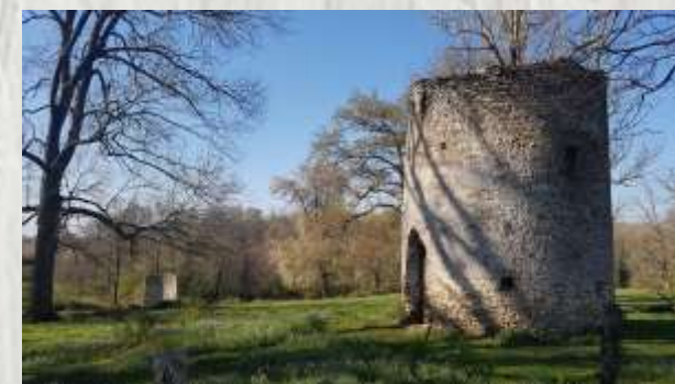
Domaine d'aiguillon

Le cours d'eau dont cet itinéraire bucolique vous fait parcourir de part et d'autre le vallon porte un nom source de confusion : le ru d'Ancoeuil. Un peu avant Blandy-les-Tours, il se nomme l'Ancoeur puis, après la traversée du parc de Vaux-le-Vicomte, l'Almont.