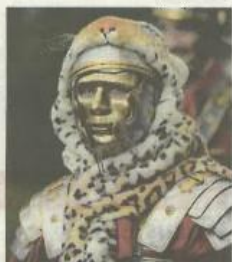
Vous devrez choisir un profil de personnages avec ses spécificités propres. Germanicus

Voici une expérience qui devrait ravir les mordus d'escape game. Le 7 juillet prochain, l'équipe du projet Germanicus va vous proposer une animation unique en son genre à Chaumes-en-Brie : passer une journée dans la peau d'un Gaulois ou encore d'un légionnaire romain, vêtus de la tête au pied avec des costumes d'époque.