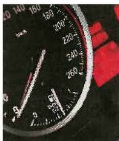
Le conducteur roulait à plus de 60 km/h au-dessus de la vitesse autorisée

Egalement en permis probatoire obtenu en 2022, le conducteur transportait avec lui trois passagers, le tout sur une