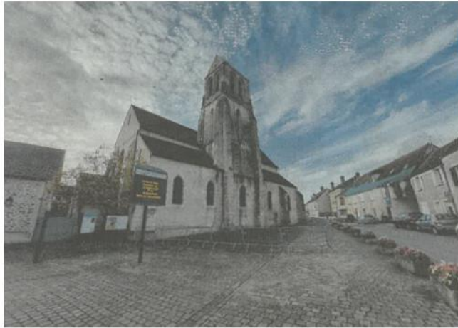
L'église de Soignolles-en-Brie est fermée au public, à la suite d'importantes dégradations survenues lors de travaux de restauration. ILRISM77

Mais au cours du sondage des murs de l'église, l'architecte habilité par les Monuments historiques s'est aperçu que des creux entre les pierres devaient être préalablement rebouchés. « Les études ont démontré qu'il fallait utiliser du liant à divers endroits des murs du bâtiment. Suite à ces injections, le liant apporté a pro-