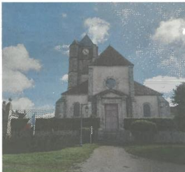
L'église Saint-Martin a besoin de travaux de restauration Ville d'Ozouer-le-Voulgis

Érigé sur un ancien oratoire du XIII e siècle, l'édifice de style