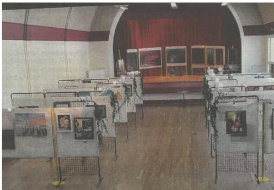
34 artistes locaux exposeront leurs œuvres à la salle des fêtes de Fontaine-le-Port. Comité des fêtes de Fontaine-le-Port

Cette année, Agnès Meunier, peintre de Fontaine-le-Port, est l'invitée d'honneur. Celle qui peint depuis une quarantaine d'années exposera une dizaine