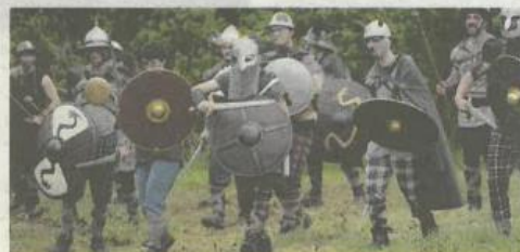
La charge des barbares. Germanicus