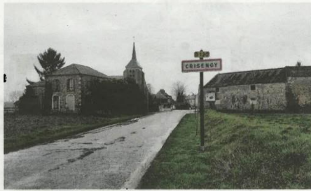
Depuis près de 20 ans, le village de Crisenoy, 610 habitants, se bat contre un projet d'entrepôt logistique qui doit voir le jour à Fouju, la commune voisine. S. KSM77

Il vise aussi « des objectifs de préservation et de mise en valeur de la biodiversité » et la prise en compte de « la dimension patrimoniale et paysagère » du territoire, retrace la cour administrative d'appel de