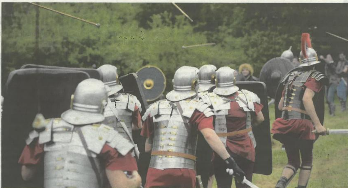
Cet escape game d'un nouveau genre propose d'incarner des Romains et des Gaulois en costumes d'époque. Germanicus