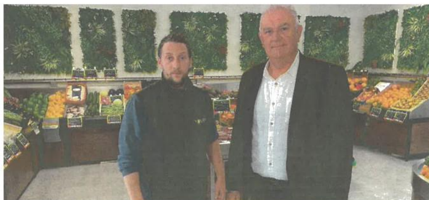
Le gérant du magasin Youpi et le maire de Machault partagent la même vision pour le village.

C'est dans la partie déjà rénovée de la ferme des Trois-Maillets, spécialement aménagée pour les commerces de proximité, que Youpi a pu s'installer. Plusieurs marchandises vendues chez lui sont produites en Seine-et-Marne. Les clients peuvent ainsi s'appro-