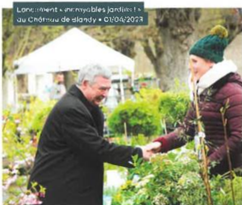
Lancement « immortables jardins » au Château de Blandy • 01/04/2023

Habilitation par l'État (en octobre 2021) du service archéologique de la Direction des Affaires Culturelles du Département pour la réalisation de diagnostics d'archéologie préventive.