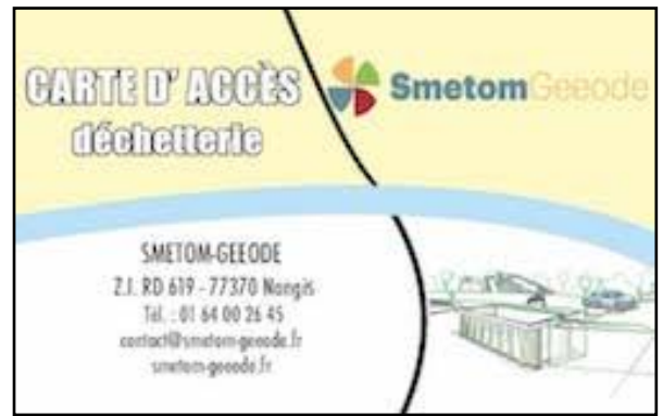
Une carte_dédiée aux services

Pour les professionnels la carte est gratuite sous conditions. Les apports sont payants, selon la nature des déchets déposés. Les tarifs sont fixés par délibération.